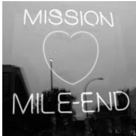
Mission communautaire de Mile-End, 99, rue Bernard Ouest, (514) 274-3401

MISSION COMMUNAUTAIRE DE MILE-END comble les besoins pratiques, émotionnels et spirituels des personnes à faible revenu du quartier, peu importe leurs croyances religieuses et leurs origines ethniques. Depuis 1991, l'organisme a aidé des milliers de personnes dans le besoin en leur fournissant des vêtements ou de la nourriture, ou en les soutenant dans une situation de crise, entre autres. Chaque année, la banque alimentaire distribue 15 000 paniers de provisions, et l'organisme sert environ 5 000 repas, deux fois la semaine. L'environnement sécuritaire et accueillant de la mission constitue un havre de paix et de ressourcement pour bon nombre de personnes vulnérables.