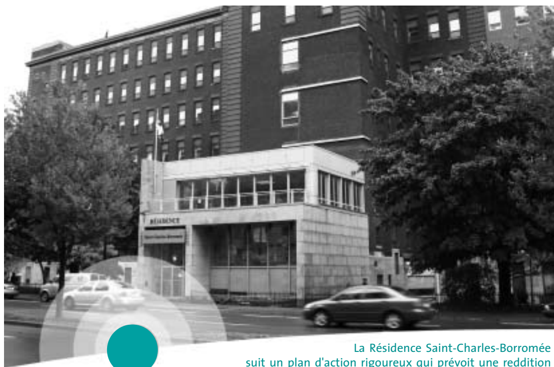
La Résidence Saint-Charles-Borromée suit un plan d'action rigoureux qui prévoit une reddition de comptes à un consortium, à tous les trois mois.

À LA MI-OCTOBRE, un quotidien montréalais dévoilait les conclusions du rapport d'une visite d'appréciation de la qualité des services effectuée par le ministère de la Santé et des Services sociaux (MSSS), en novembre 2004, à la Résidence Saint-Charles-Borromée. La Direction générale associée n'a pas tardé à réagir. À un point de presse tenu le jour même, elle a rappelé que le rapport, vieux d'un an, ne reflétait pas la situation actuelle, compte tenu des progrès notables qui avaient été accomplis depuis. Cette sortie publique lui a valu l'appui des résidents et des familles, mais aussi ceux du ministre de la Santé et des Services sociaux, Philippe Couillard, de l'Ordre des infirmières et infirmiers du Québec (OIIQ), et du Curateur public.