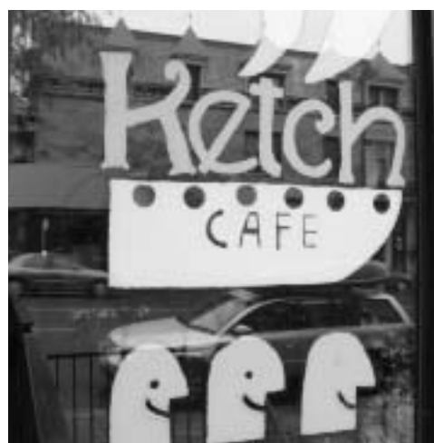
Le Ketch Café, 4707, rue Saint-Denis, (514) 985-0505

LE KETCH CAFÉ est une ressource communautaire qui offre aux jeunes de la rue un lieu de rencontre, des activités culturelles et sociales ainsi que des services médicaux, sociaux et psychologiques. L'organisme a vu le jour en 2000 grâce à un partenariat entre l'équipe jeunesse du CLSC du Plateau Mont-Royal, l'organisme Plein Milieu (travail de rue et de milieu) et le centre de jour communautaire les Dîners-rencontres Saint-Louis-de-Gonzague. Les intervenants utilisent une approche clinique basée sur l'écoute des jeunes, en tenant des rencontres dans un lieu qui permet d'aménager des espaces intimes et privés. Le Ketch Café est ouvert du jeudi au lundi, entre 16 h et 22 h.