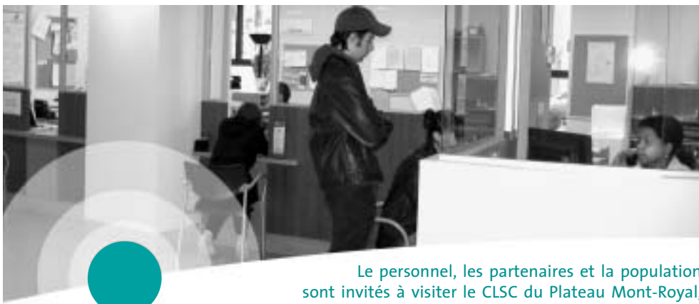
Le personnel, les partenaires et la population sont invités à visiter le CLSC du Plateau Mont-Royal, le 23 novembre prochain. Ci-contre, la salle d'attente.