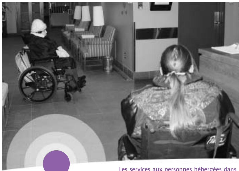
Les services aux personnes hébergées dans les centres d'hébergement du CSSS Jeanne-Mance font aussi partie du projet d'organisation clinique.

— le conseil multidisciplinaire, le conseil des médecins, dentistes et pharmaciens, le conseil des infirmières et des infirmiers et le conseil des infirmières auxiliaires — ainsi que les syndicats et les associations professionnelles. Près de 600 personnes ont assisté à ces consultations.