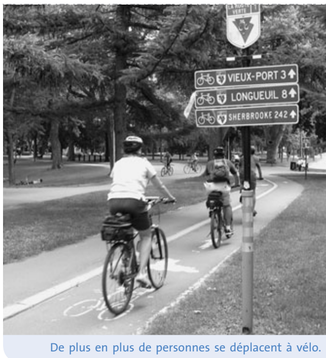
De plus en plus de personnes se déplacent à vélo.

Le trafic routier est responsable de 75 % de la pollution atmosphérique. Dans la grande région métropolitaine, il contribue à environ 78 % des émissions de monoxyde de carbone, à 85 % des émissions d'oxyde d'azote, à 42 % des émissions de gaz carbonique et à 29 % des émissions de particules toxiques. Certains de ces polluants sont directement responsables de l'augmentation des périodes de smog depuis quelques années, ainsi que de la hausse des gaz à effet de serre.