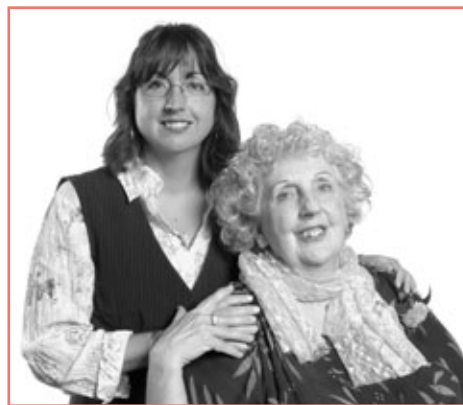
Voici quelques sourires saisis par le photographe Marcel La Haye lors de l'événement reconnaissance 2007.

SELON LE DICTIONNAIRE LAROUSSE, LA RECONNAISSANCE EST UN SENTIMENT QUI INCITE À SE CONSIDÉRER REDEVABLE ENVERS LA PERSONNE DE QUI ON A REÇU UN BIENFAIT. C'EST DANS CET ESPRIT QUE LA DIRECTION GÉNÉRALE ET LA DIRECTION DES RESSOURCES HUMAINES DU CSSS JEANNE-MANCE ONT INVITÉ LES EMPLOYÉS AYANT TRAVAILLÉ PLUS DE 25 ANNÉES AU SEIN DE L'ÉTABLISSEMENT À UNE GRANDE FÊTE ORGANISÉE EN LEUR HONNEUR. L'OCCASION RÊVÉE POUR CONVIER AUSSI À LA FÊTE CEUX ET CELLES QUI ONT PRIS LEUR RETRAITE DEPUIS LA CRÉATION DU CSSS JEANNE-MANCE!