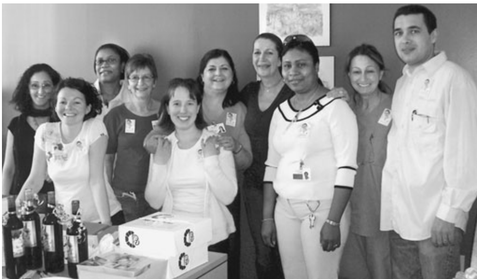
Des membres de l'équipe des infirmières auxiliaires du Centre d'hébergement du Manoir-de-l'Âge-d'Or heureux de célébrer la journée de l'infirmière auxiliaire.

leur travail et leur professionnalisme. Dîners-rencontres, pauses-café, tirages de prix... toutes les occasions étaient bonnes pour leur dire merci.