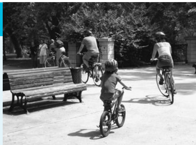
L'aménagement de pistes cyclables et d'environnements urbains sécuritaires pourrait réduire le nombre d'accidents.

Il est aussi possible de réduire le nombre de véhicules qui entrent et circulent dans la ville. Cela