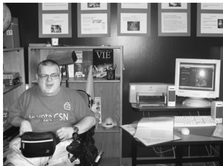
Jacques Robert a choisi un sujet d'actualité: les ordinateurs et l'informatique.