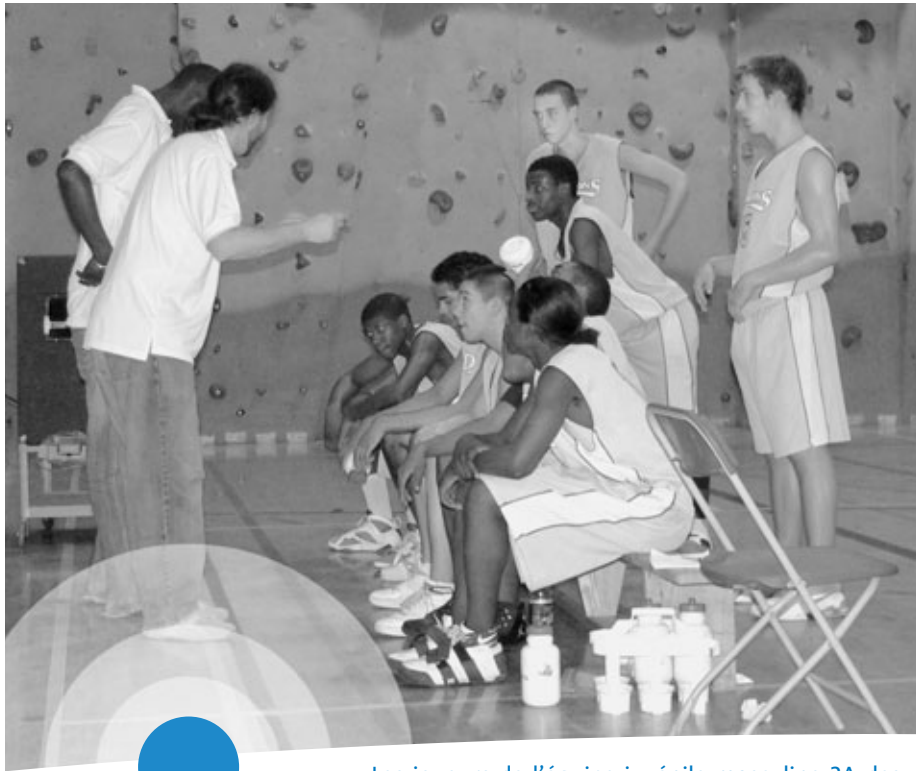
Les joueurs de l'équipe juvénile masculine 2A des Dragons sont attentifs aux conseils de leur entraîneur.

Démarré il y a huit ans, Bien dans mes baskets a été mis en veilleuse quelque temps puis relancé en septembre 2006. Le projet bénéficie maintenant de l'appui de la Fondation du CSSS Jeanne-Mance et de ses partenaires.