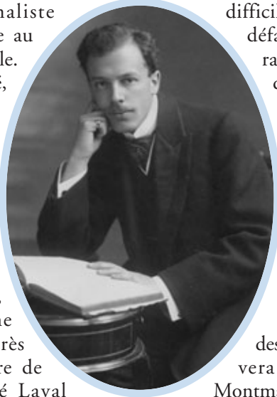
Armand Lavergne.

En octobre 1933, Armand Lavergne appuie Maurice Duplessis lors du congrès à la chefferie du Parti conservateur à Sherbrooke. Peu après, il se sépare presque complètement du parti conservateur et rédige ses mémoires. L'ouvrage, intitulé Trente ans de vie nationale , paraîtra le 15 mars 1935, dix jours après son décès à Ottawa, survenu à la suite d'une pneumonie. Sur sa pierre tombale, au cimetière d'Arthabaska, il est inscrit: « Pour sauver nos droits, il faut combattre et se sacrifier ». Armand Lavergne fut une des figures les plus originales de la vie parlementaire canadienne et québécoise. Force est d'admettre que nous lui devons, entre autres, d'être ce que nous sommes, des francophones d'Amérique.