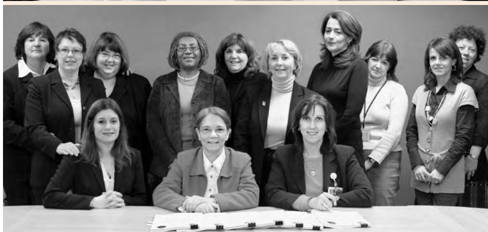
Le Jeanne-Mance était présent lors des séances de signatures des conventions collectives locales négociées entre la direction de l'établissement et le Syndicat des travailleurs et travailleuses du CSSS Jeanne-Mance (photo du haut) ainsi qu'avec la Fédération interprofessionnelle de la santé du Québec et l'Alliance interprofessionnelle de Montréal (photo du bas).

document. Ces instances syndicales représentent les quatre catégories d'employés du CSSS.