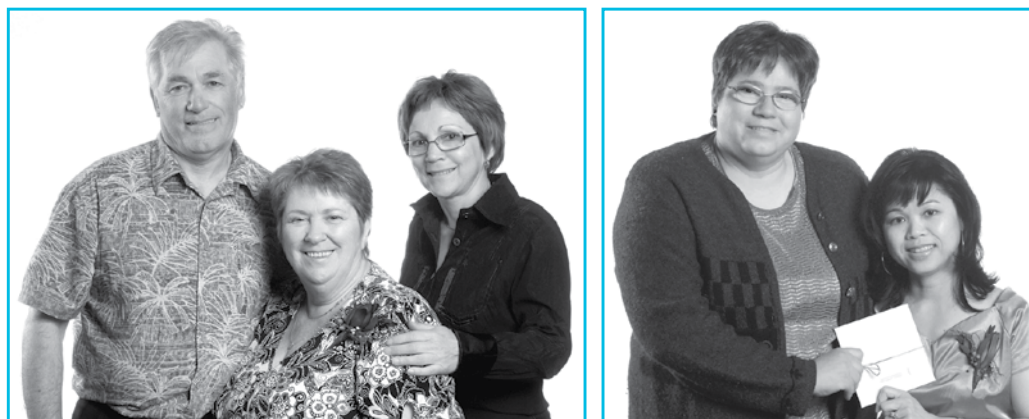
Le photographe Marcel La Haye a, cette année encore, saisi quelques sourires éloquentes lors de la soirée reconnaissance 2008.

LE MOIS DE MAI AURA ÉTÉ FERTILE EN ACTIVITÉS visant à rendre hommage au dévouement et à la loyauté des employés du CSSS Jeanne-Mance. Le mercredi 21 a eu lieu l'événement phare, la fête en l'honneur des employés qui avaient cumulé 25 années de service ou pris leur retraite en 2007.