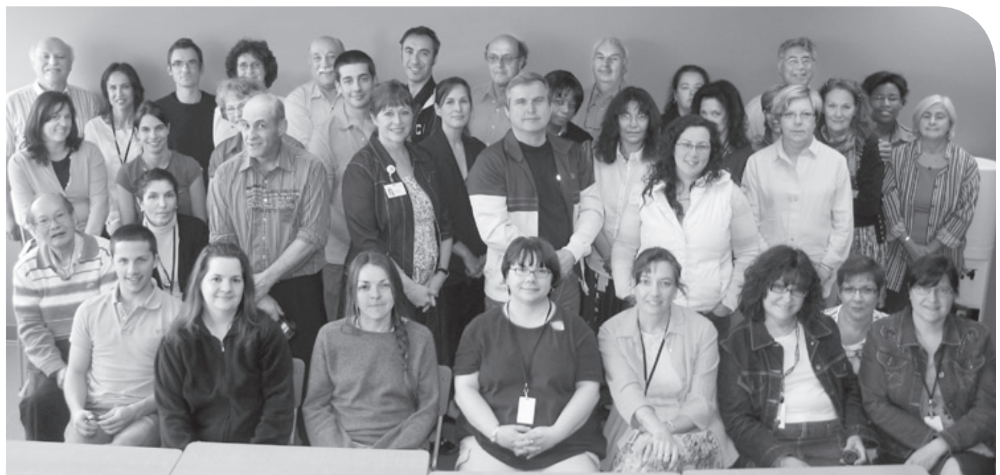
Portrait de groupe pour l'équipe santé au travail du CSSS Jeanne-Mance.

Il ne faut pas confondre le programme Santé au travail avec la Coordination de la gestion de la présence au travail, qui relève de la Direction des ressources humaines (bureau de santé) et est située au 1200, avenue Papineau.