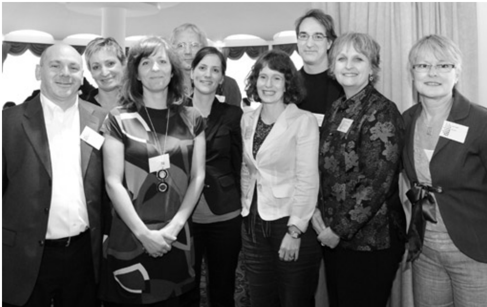
Le comité organisateur de la troisième journée annuelle d'échanges des CSSS-CAU du domaine social.

Cette journée a permis aux participants de réfléchir sur les questions éthiques qui se posent pour les CSSS-CAU, de partager leurs expertises et de créer des espaces de réflexion communs.