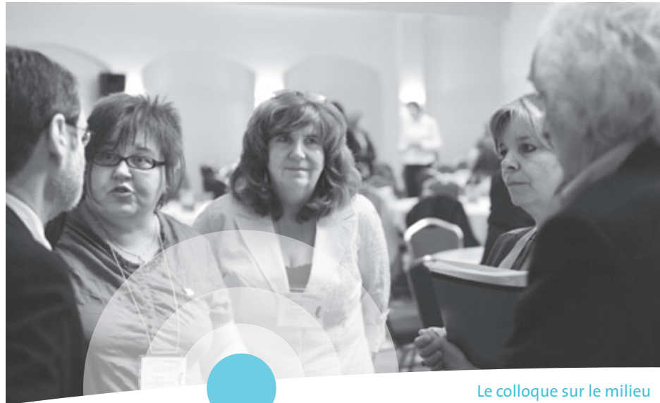
Le colloque sur le milieu de vie est un véritable lieu d'échanges.

C'EST SUR LE THÈME DE LA SANTÉ MENTALE que s'est tenu le colloque sur le milieu de vie, le 28 mai dernier. Cette activité est organisée à l'intention des intervenants des centres d'hébergement du CSSS Jeanne-Mance et, année après année, elle connaît un grand succès. Le colloque offre une occasion exceptionnelle de rencontre où des collègues partagent et font des apprentissages en rapport avec l'approche milieu de vie. Pour cette quatrième édition, le comité organisateur avait conçu un programme de conférences et d'ateliers des plus intéressants sur divers aspects de la santé mentale en centre d'hébergement.