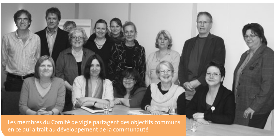
Les membres du Comité de vigie partagent des objectifs communs en ce qui a trait au développement de la communauté

favoriser la convergence des actions. Les membres du comité ont cerné deux grands enjeux communs touchant le territoire du CSSS Jeanne-Mance: la préservation de la mixité sociale et la lutte contre la pauvreté. Pour agir sur ces grands enjeux, le comité a ciblé trois priorités de développement social: l'accès au logement, la sécurité alimentaire ainsi que l'insertion sociale et professionnelle. Pour améliorer la santé et le bien-être de la population, il faut collectivement travailler à