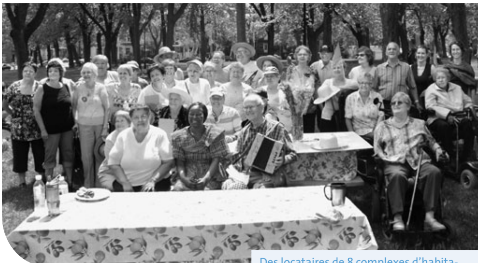
Des locataires de 8 complexes d'habitation à loyer modique pour les personnes âgées du Grand Plateau ont participé à l'activité Super voisin, super voisine visant à encourager l'entraide, la solidarité et le bon voisinage.

OCTOBRE 2011 MARQUERA le trentième anniversaire de la table de concertation Alliances 3 e âge Grand Plateau. Créée par des intervenants du CLSC Saint-Louis-du-Parc en 1981, elle regroupe 16 organismes publics, privés et communautaires qui travaillent à améliorer la qualité de vie des aînés des quartiers Saint-Louis, Mile-End et Plateau-Mont-Royal. La force de ce regroupement repose sur la possibilité qu'il offre à ses membres de se rencontrer et de s'informer des divers projets destinés aux personnes âgées du territoire. La liste des activités des organismes membres et des services qu'ils fournissent est impressionnante: accompagnement, transport, formation, prévention, alimentation, sécurité, activité physique, etc.