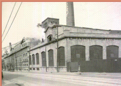
Usine Molson vers 1910.

Sainte-Marie détient de tristes records à cet égard. En 1895, le taux de mortalité y est de 33,2 pour mille. En 1920, le taux de mortalité infantile y est de 213 pour mille. En 1926, une loi imposant la pasteurisation du lait vient remédier à une partie importante du problème.