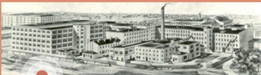
Usine de la Canadian Rubber (Uniroyal), vers 1894.

Des immigrants arrivent à Montréal et des Canadiens français quittent les campagnes du Québec, qui ne parviennent plus à les faire vivre, pour s'établir en ville, là où il y a des emplois dans les nouvelles manufactures. Si certains artisans travaillent à domicile pour les usines, la plupart des travailleurs vivent près de leur lieu de travail. Les rues commencent alors à se développer vers le nord.