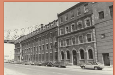
Anciens bâtiments de Uniroyal Rue Notre-Dame, vers 1995