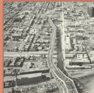
Vue du pont Jacques-Cartier et du Centre-Sud

Jamaïque, Hong Kong, Italie, Belgique, Pologne, Roumanie, Iran, El Salvador, Russie, Bangladesh, Hongrie, Grèce, Allemagne et Portugal.