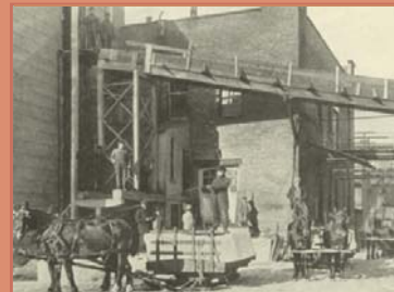
Laiterie Montreal Dairy Rue Papineau, vers 1912

Après la guerre de 1939-1945 vient une période de prospérité importante qui durera trente ans : les Trente Glorieuses. Cette période engendre une amélioration des conditions de travail (notamment des salaires) des ouvriers qui augmentent leur pouvoir d'achat et acquièrent divers biens de consommation : réfrigérateur, cuisinière, laveuse, sècheuse et automobile, symbole par excellence de la modernité et de la prospérité.