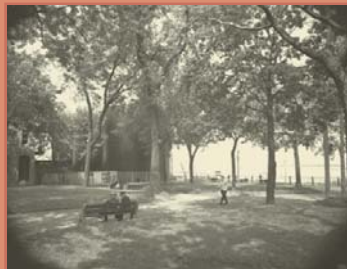
Le Parc Bellerive

À partir du milieu du XIX e siècle, jusqu'à la Seconde Guerre mondiale, le quartier Centre-Sud se développe à un tel rythme qu'en 1941, on y dénombre 100 000 habitants. Au cours de ce siècle, l'industrialisation suscite de nombreuses possibilités de travail dans les manufactures florissantes du Centre-Sud, ce qui a pour conséquence l'augmentation importante des rangs ouvriers et de la main-d'œuvre chez les petits commerçants et dans les services publics.