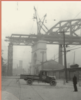
Le pont Jacques-Cartier en construction

On observe alors une aggravation du phénomène de la pauvreté dans le quartier. Alors que jadis les ouvriers étaient